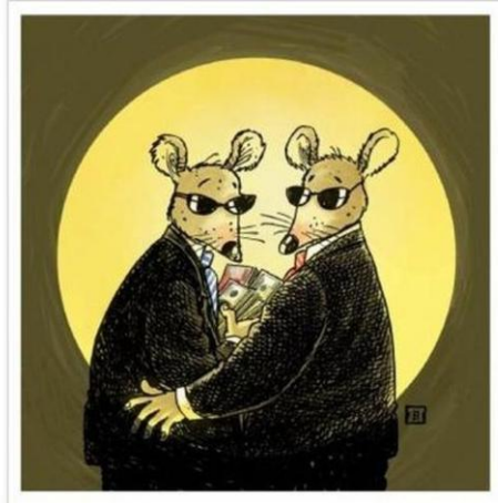
Ilustrasi koruptor.

M enteri Koordinator Bidang Kemaritiman dan Investasi (Menko Marves) Luhut Binsar Pandjaitan memberikan pesan kepada Presiden Terpilih Prabowo Subianto.