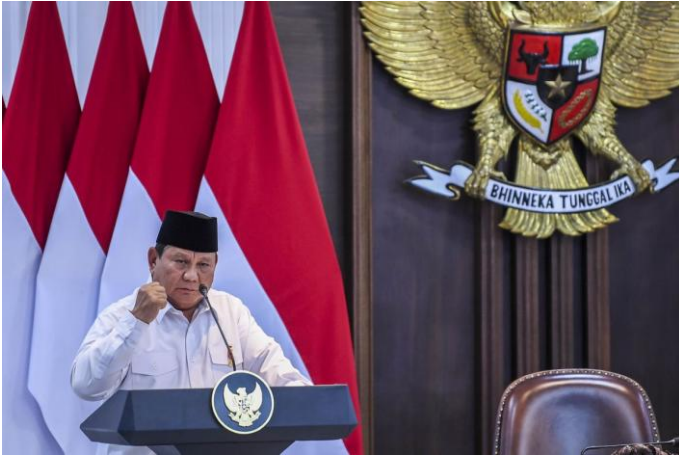
Presiden Prabowo Subianto.

B endera One Piece sungguh menyita perhatian publik belakangan ini. Baik bermotif ekonomi maupun politik, momentumnya tepat. Saat bangsa Indonesia hendak memasuki Agustus 2025, bulan kemerdekaan Indonesia.