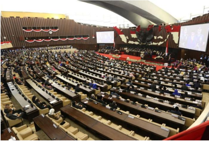
Suasana Sidang Tahunan MPR yang berlangsung di Kompleks Parlemen, Senayan, Jakarta, Kamis (16/8/2018) (Andreas Lukas Altobelli/KOMPAS.com).

B elakangan ini pemimpin Majelis Permusyawaratan Rakyat (MPR) melakukan “silaturahmi kebangsaan” dengan sejumlah tokoh nasional. Topik yang didiskusikan di antaranya soal perlunya amandemen Undang-Undang Dasar (UUD) untuk mengembalikan supremasi MPR.