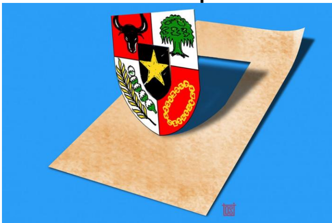
Ilustrasi Pancasila.

"Ilmu pengetahuan hanyalah berharga penuh jika ia dipergunakan untuk mengabdikan kepada praktek hidup manusia, atau prakteknya bangsa, atau praktek hidupnya dunia kemanusiaan." (Bung Karno)